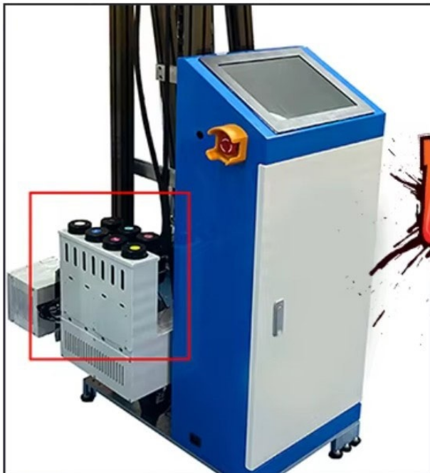
A mi nyomtatónk